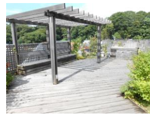
屋上ガーデニング