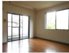
洋室 角部屋 窓2カ所