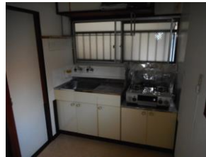
キッチン ガスコンロ付