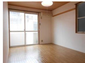
洋室 角部屋 窓2カ所