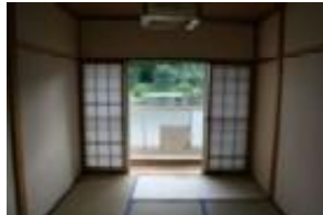
和 バルコニー 犀川向き