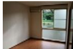
洋6 正面 桜の木あり