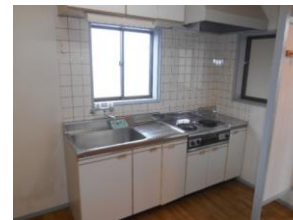
キッチン 2口電気コンロ