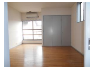
洋室 収納 窓2カ所