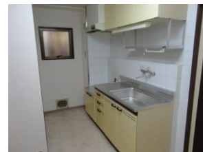
キッチン ガスコンロ2口可