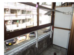
バルコニー屋根付