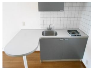
キッチン 1口ガスコンロ付