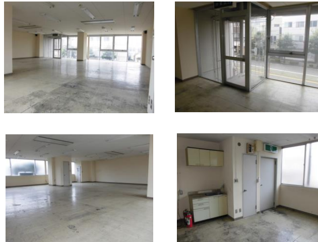
◎図面や画像と現況に相違がある場合は、現況優先とします。