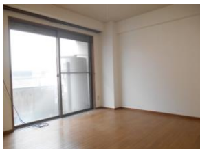
洋室 バルコニー南向き