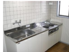
キッチン 2口電気コンロ