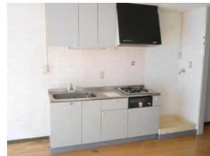
システムキッチン