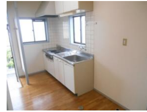
キッチン 2口電気コンロ