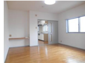
洋室 窓2ヶ所 角部屋