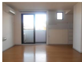
ロフト バルコニー