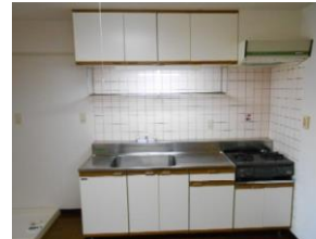
流し台 ガスコンロ