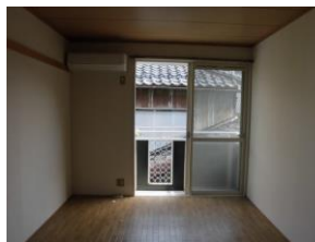
洋室 角部屋 窓2カ所