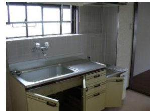
キッチン ガスコンロ2口可