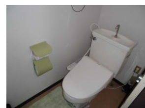
トイレ ウォシュレット