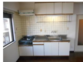
流し台 ガスコンロ