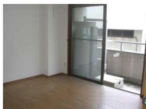
洋室 バルコニー南向き