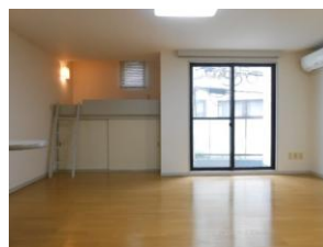
ロフト バルコニー