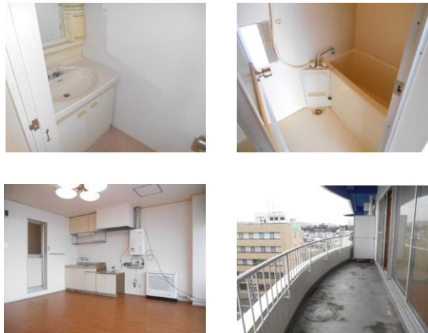
◎図面や画像と現況に相違がある場合は、現況優先とします。