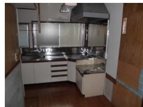
キッチン 都市ガス