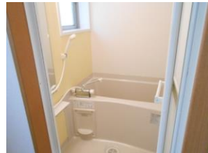
浴室ユニットバス