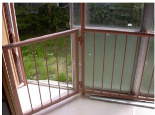
サンルーム 1階庭付