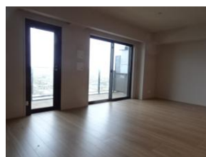
リビングダイニング16.4帖