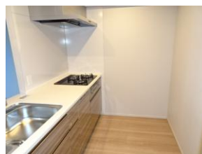
対面システムキッチン