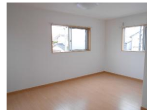
2階 洋9 南向き、SR付