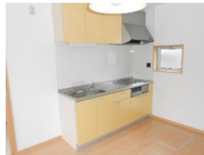
システムキッチンIHコンロ