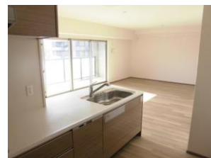
対面カウンターキッチン