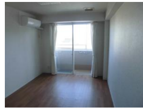
エアコン バルコニー