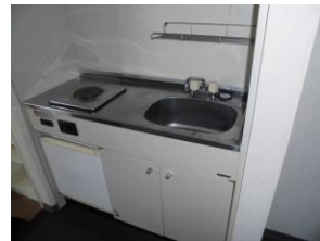
キッチン ミニ冷蔵庫