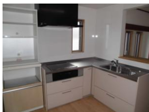
L型 システムキッチン